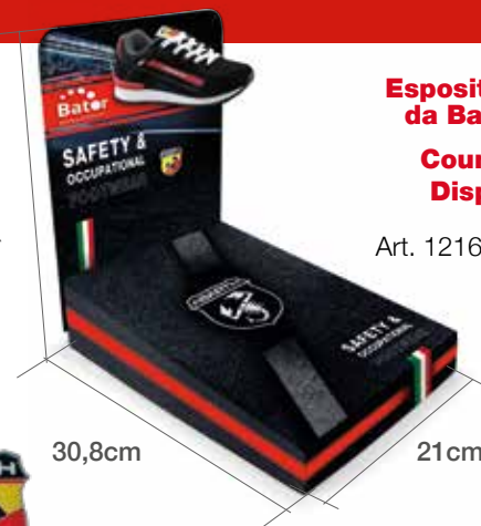
Espositore da Banco Counter Display