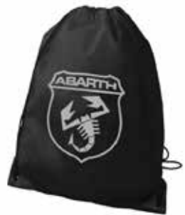
Sacca promozionale Abarth