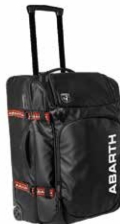
TROLLEY Nero poliestere