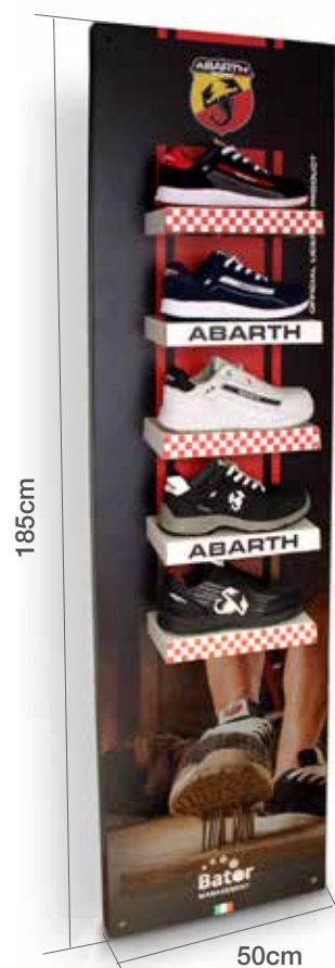
Tower display 6 positions (with flag)