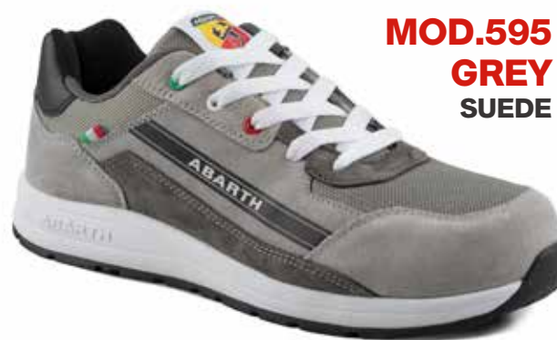
MOD.595 GREY SUEDE