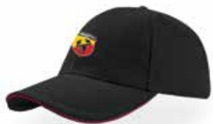
Cappellino Promozionale Promotional Cap