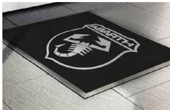
Tappeto Promozionale Promotional Carpet