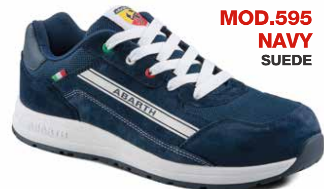
MOD.595 NAVY SUEDE