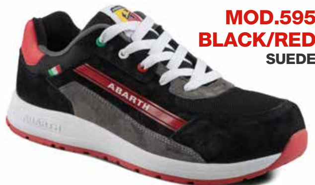
MOD.595 BLACK/RED SUEDE