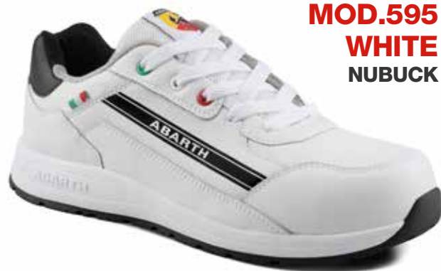
MOD.595 WHITE NUBUCK