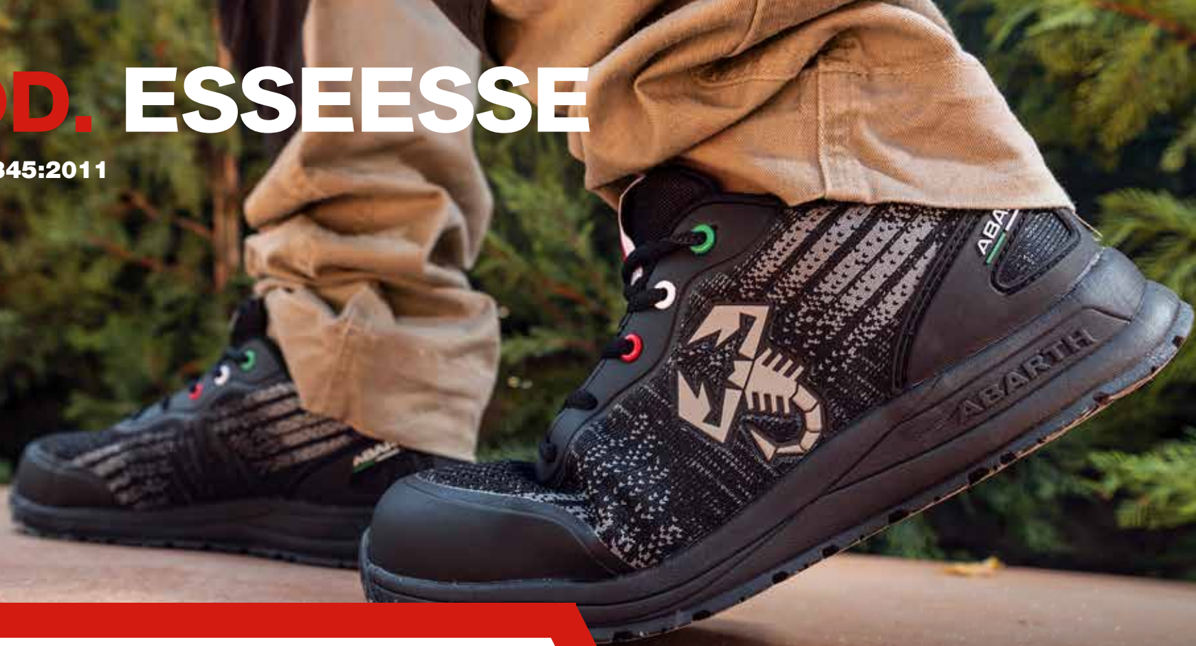
MOD. esseesse BLACK