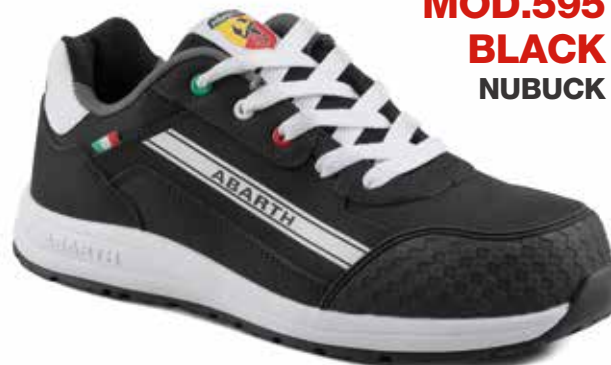
MOD.595 BLACK NUBUCK