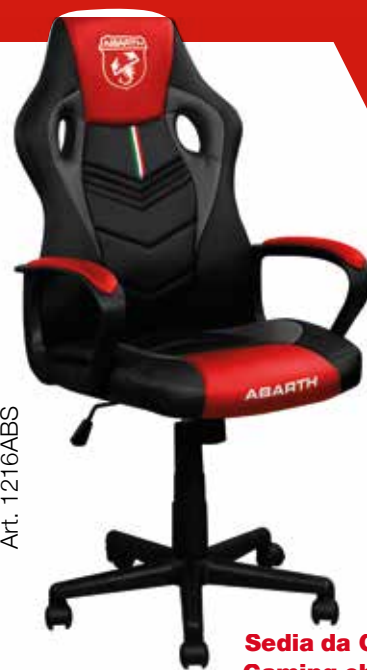
Sedia da Gaming Gaming chair